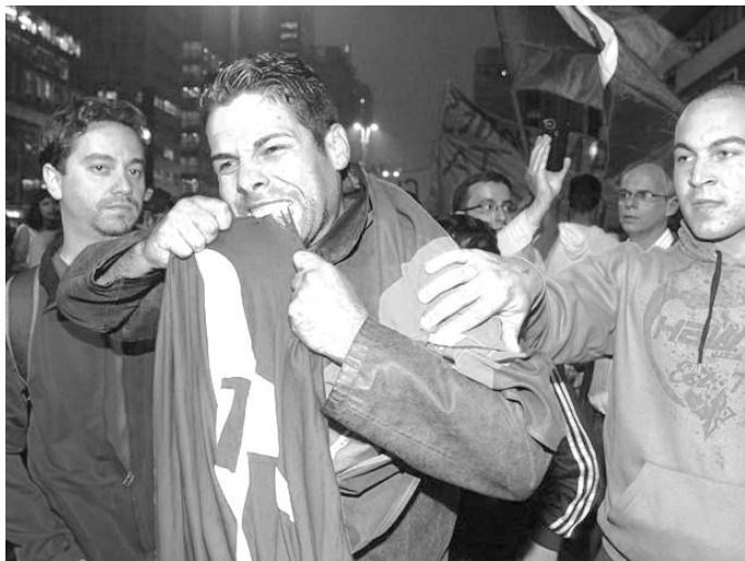
(Manifestante tenta comer bandeira de partido em São Paulo)